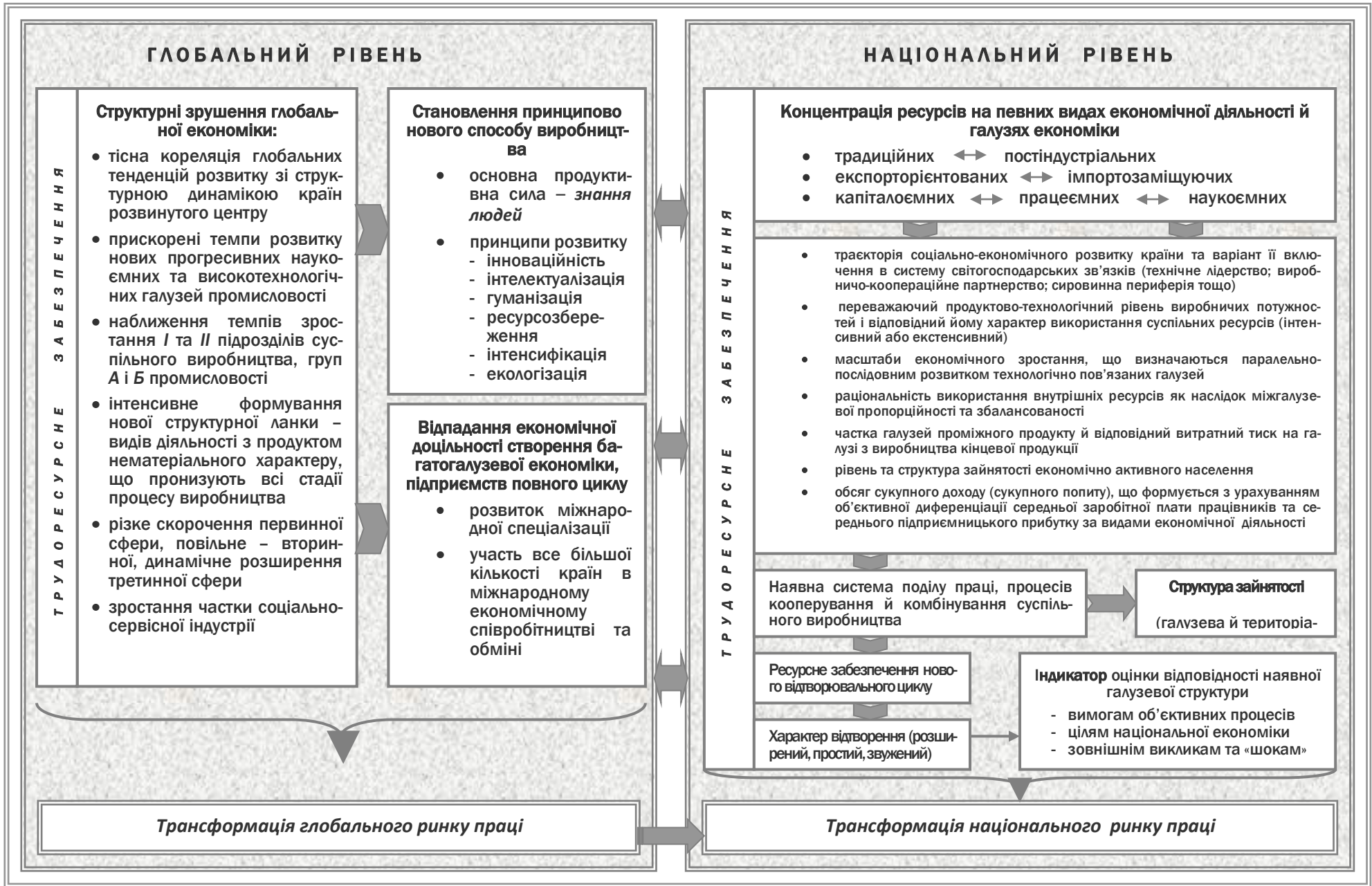
Рис. 2. Концептуальна схема структурної трансформації глобального і національного ринків праці